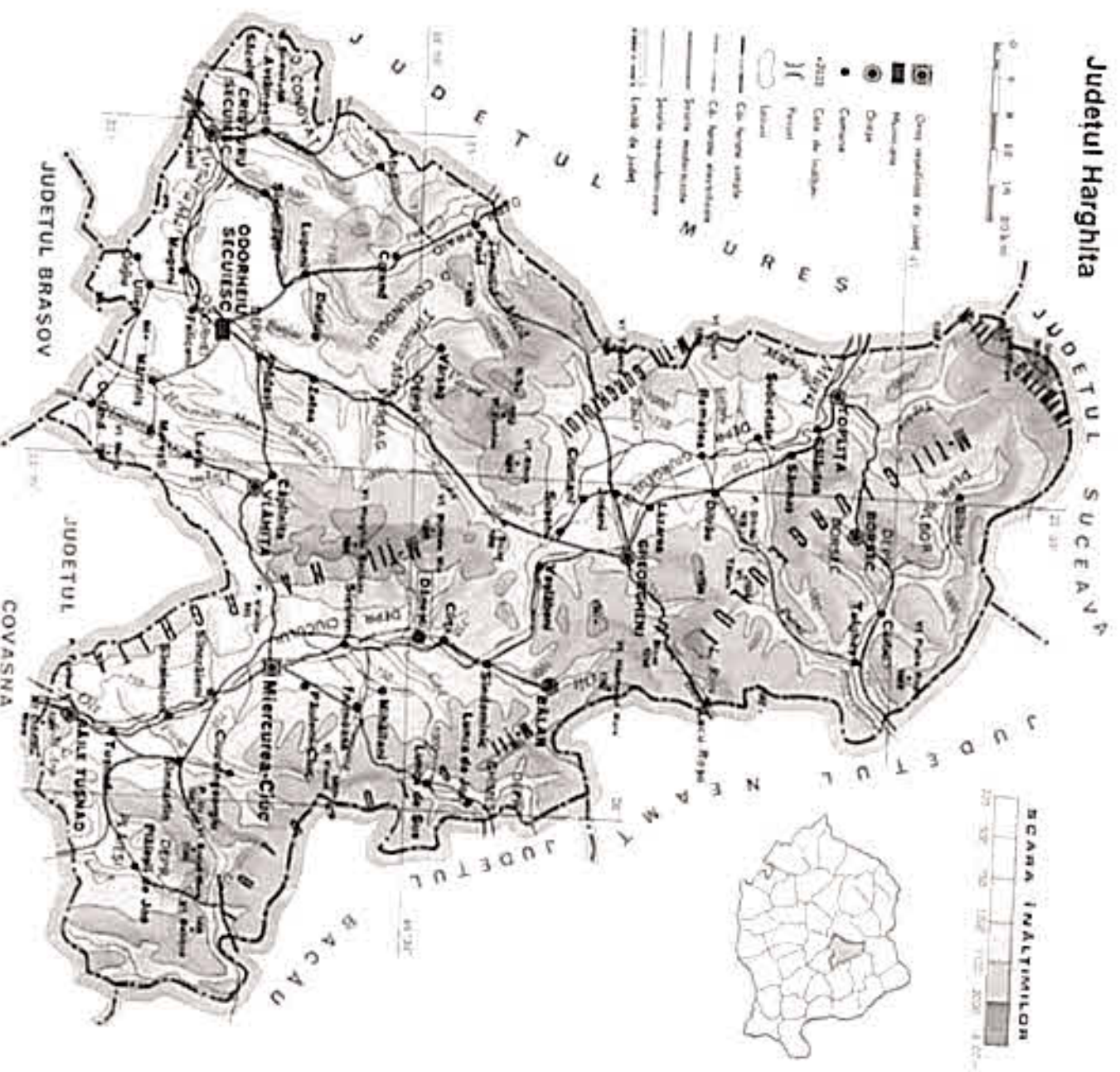
Fig. 2. Încadrarea comunei Dănești în Județul Harghita